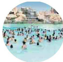
ETNALAND Le onde più grandi in una piscina a due passi dal vulcano