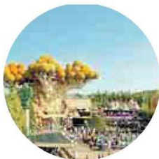
GARDALAND Oblivion: rollercoaster, caduta da 42 metri, inclinazione 87%