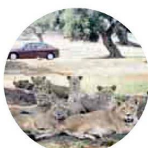
FASANOLANDIA Felini in libertà e orsi polari nel bel parco faunistico