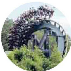
MIRABILANDIA Katun: a 110 km orari, per 1.200 metri, salto di 50 metri