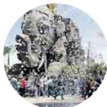
CINECITTÀ WORLD In Darkmare si viaggia in un set maledetto fino agli inferi